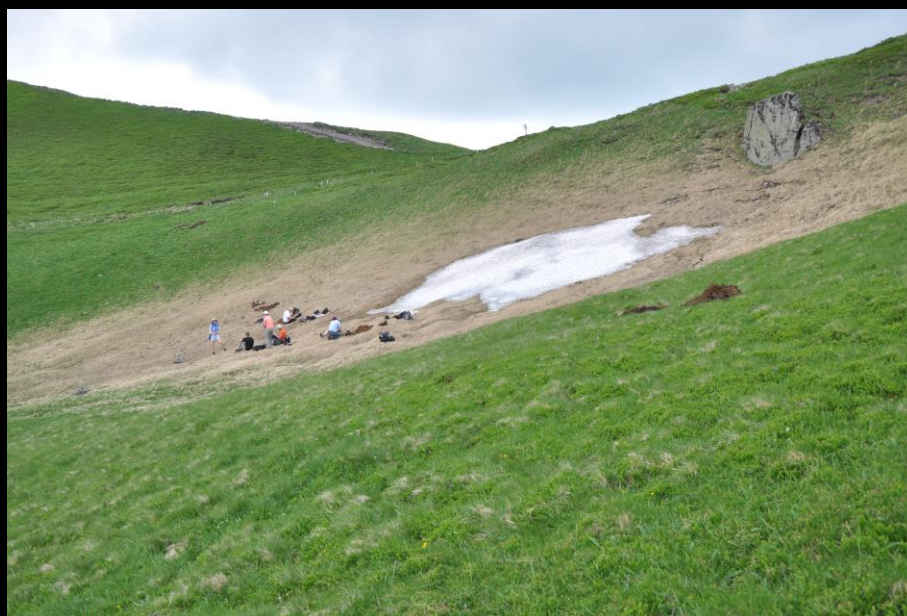
Badania w masywie Mont Dore (Francja)