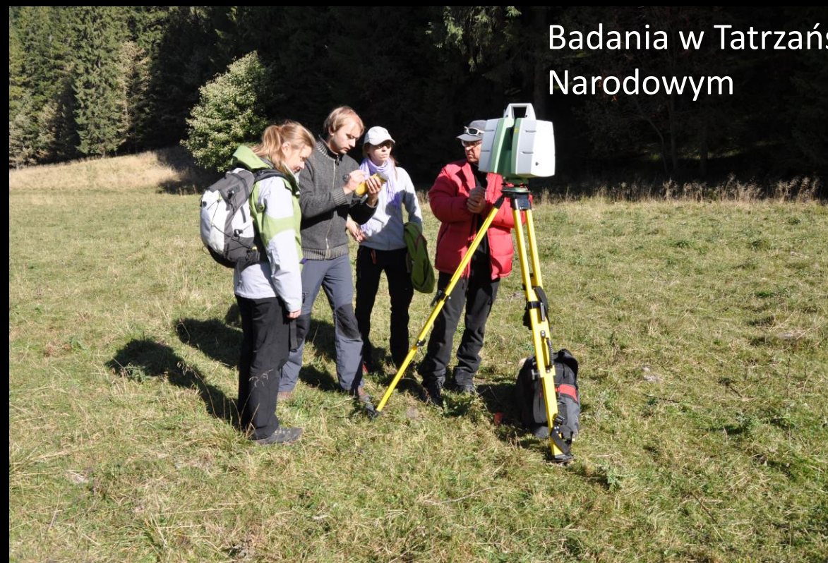
Badania w Tatrzańskim Parku Narodowym