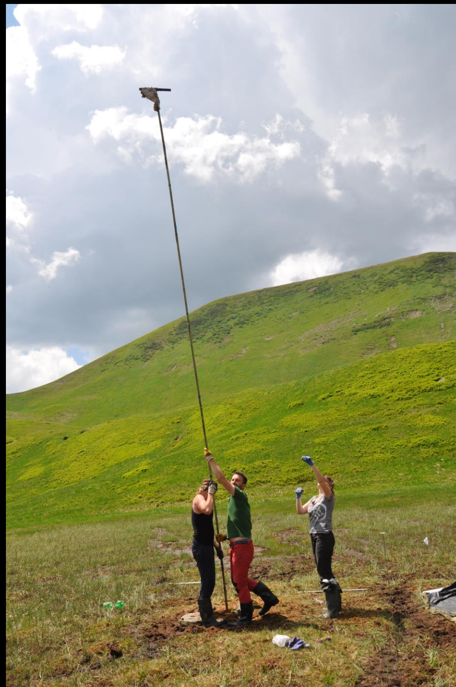
Badania na Świdowcu (Karpaty Ukraińskie)