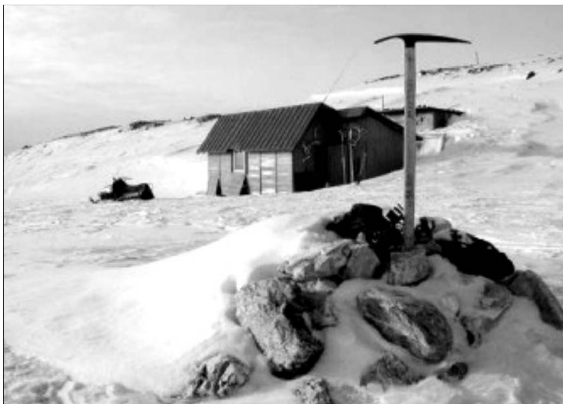
Stacja Polarna im. S. Baranowskiego Uniwersytetu Wrocławskiego na Spitsbergenie