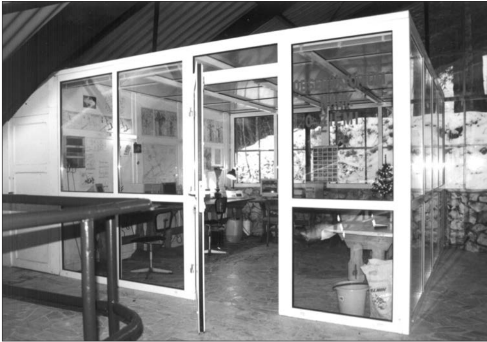
Obserwatorium Nauk o Ziemi przy Jaskini Niedźwiedziej w Kletnie (Masyw Śnieżnika Kłodzkiego)