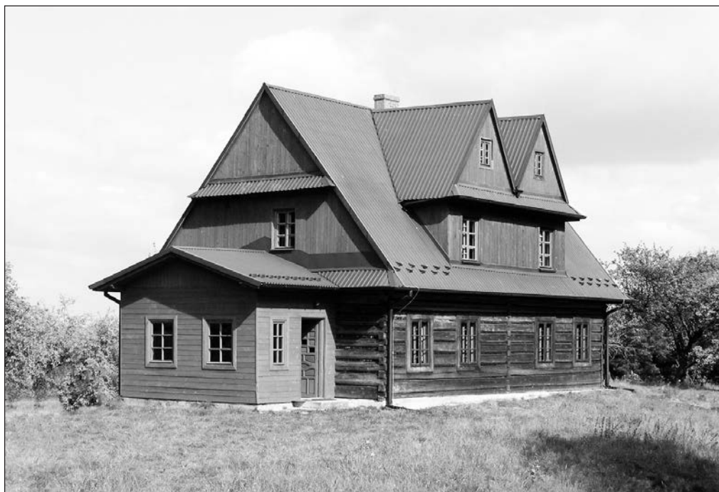
Stacja Naukowo-Badawcza IGiGP UJ w Gaiku-Brzezowej k/Dobczyc