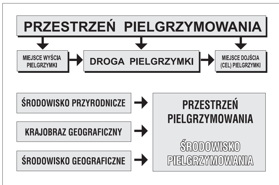
Ryc. 1. Środowisko geograficzne a przestrzeń pielgrzymowania.