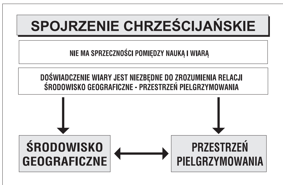
Ryc. 2a. Chrześcijańskie spojrzenie na środowisko przyrodniczo-geograficzne.